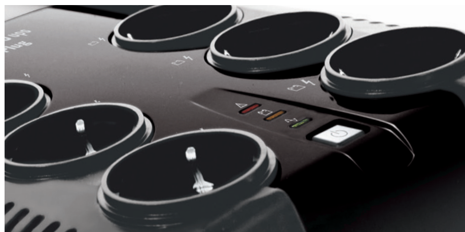
FUSIBLE DE PROTECCIÓN